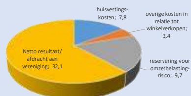
Grafische weergave van de besteding van de opbrengst van de winkerverkopen